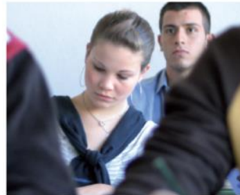
MSA Der mittlere Schulabschluss 2009